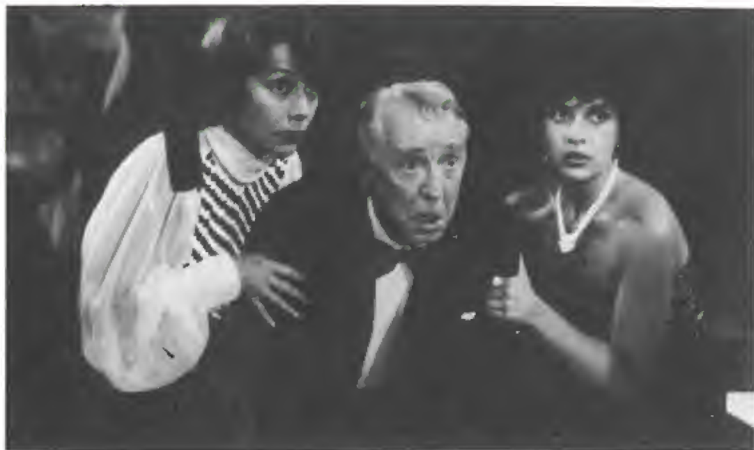
Julita Martínez - Paco Martínez Soria - Adriana Ozores